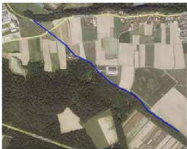
Slika 2: Abrasiv - Odsek 2.2

Voda je osnovna življenjska dobrina, ki postaja vse bolj tudi strateška. Kakovostna vodooskrba ni samoumevna in prav je, da jo uredimo čim trajnejše, kot to počnemo s projektom Oskrba s pitno vodo v porečju Drave – 3. sklop . V projektu poleg občine Muta sodelujejo še občine: Dravograd, Radlje ob Dravi, Vuzenica in Podvelka. Z naložbo bomo zagotovili boljše in varnejšo oskrbo s pitno vodo 18.000 prebivalcem, 5.000 prebivalcev pa bomo tudi na novo priključili na javno vodovodno omrežje. V sklopu projekta bomo zgradili preko 100 km novih cevovodov s pripadajočimi objekti in sisteme vseh petih občin povezali v enoten vodovodni sistem, s skupnim nadzornim centrom. Prebivalcem naših občin