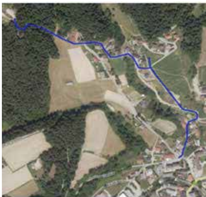
Slika 3: Vodovod Sv. Primož na Kozjaku - vod Breznik

Prav tako poteka tudi gradnja po projektu vodovod Abrasiv, in sicer odsek 2.2, v dolžini 1,3 km, ter del vo-