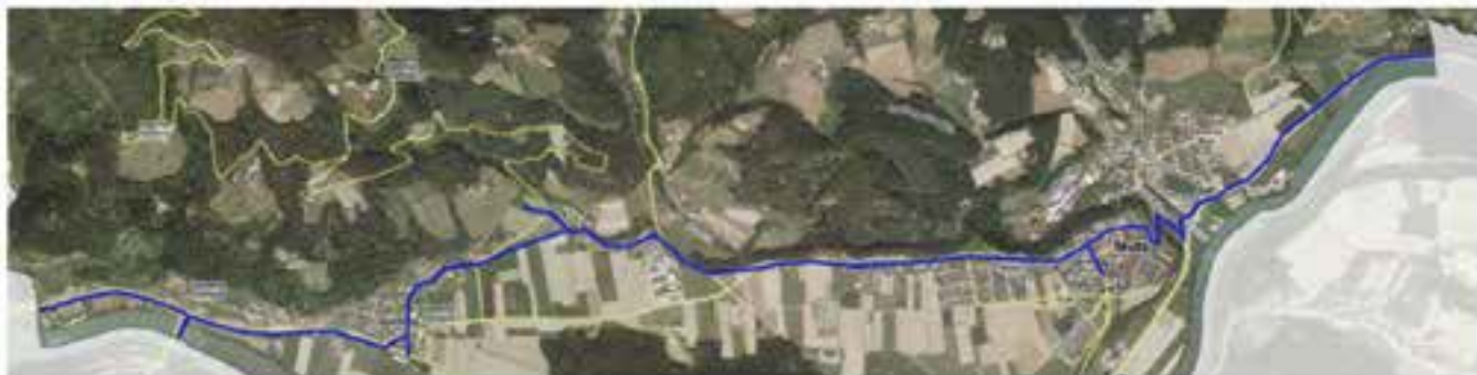
Slika 1: Povezovalni vod