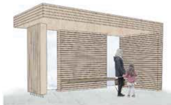
Slika 3: Avtobusno postajališče

Dovoz in izvoz za avtobus sta predvidena s priključkom na državno cesto, na lokaciji obstoječega priključka h gasilskemu domu. Obračališče za avtobus je predvideno na platuju pred gasilskim domom. Na postajališču je predvidena lesena nadstrešnica za čakanje potnikov (slika 3). Na zadnji strani postajališča sta predvideni dve stekleni steni iz lepljenega in kaljenega varnostnega stekla, na osrednji leseni steni je predvidena pritrditev lesene klopi. Stene postajališča bodo obložene z leseno horizontalno fasado, ki bo iz macesna in bo položena na leseno podkonstrukcijo.